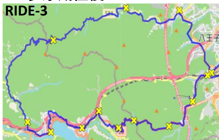
RIDE-3 和田峠相模湖周遊118km-1248m