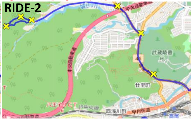
RIDE-2 八王子城往復 83km-466m