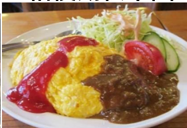
奥多摩湖へムロック