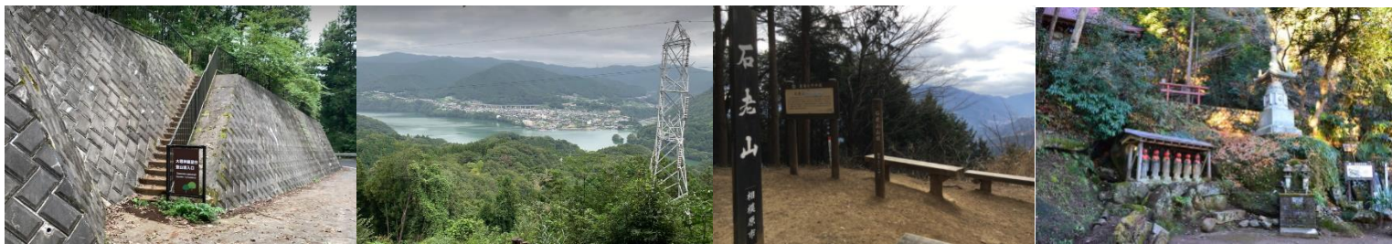
入浴・夕食推奨 相模湖プレジャーフォレスト「うるり温泉」

※石老山からゴールのうるり温泉へは、道路状況や時間に応じて大明神展望台経由での移動をします。