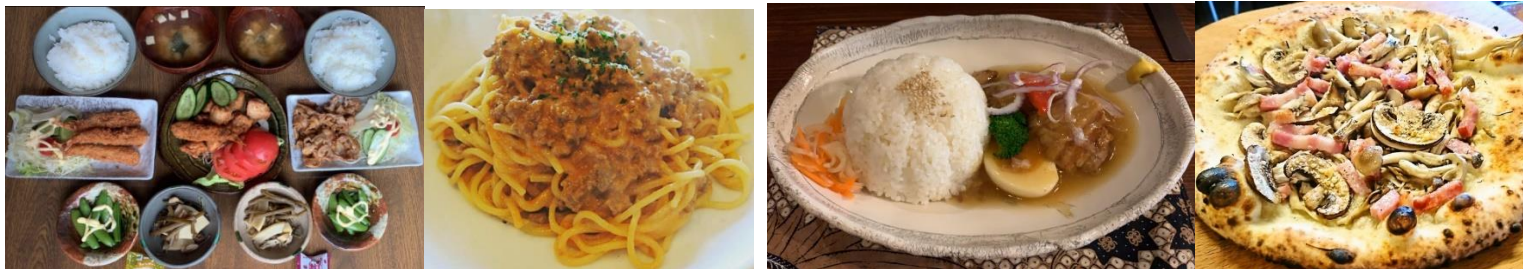
藤野駅周辺 風里 鮭ひろ 若葉そば ふじのたんぼぼカフェてくてく