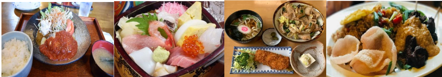
相模湖遊覧船 相模湖駅下車場～嵐山 勝瀬観光ポート・ヤマグチポート 各所要15分