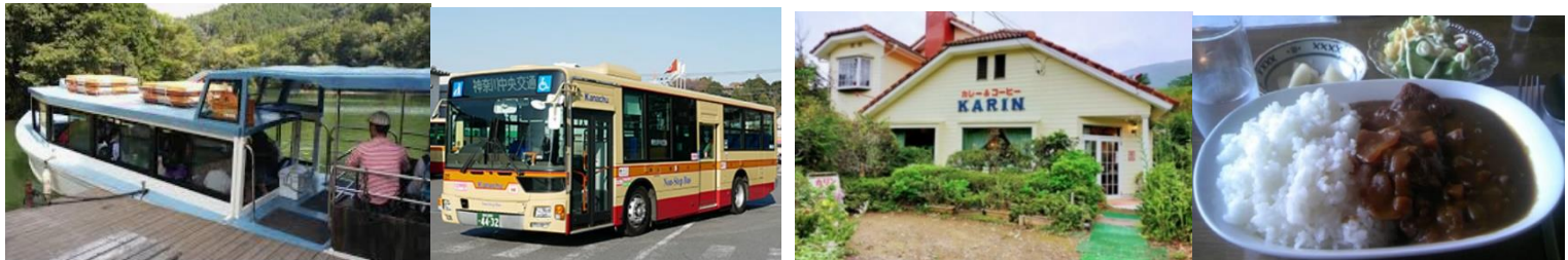
各出発時間 勝瀬橋バス停→相模湖駅(神奈川中央交通バス) 平日11:22 土日11:34