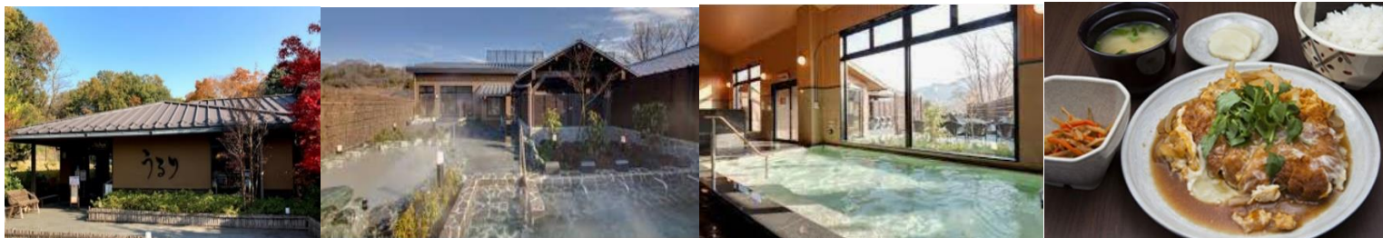
うるり温泉～相模湖駅 やまぐちポート or 神奈川中央交通バス 夕食推奨 喫茶「KARIN」