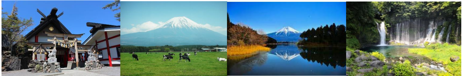
後泊推奨 くれたけインプレミアム富士宮駅前 大浴場 洋室 朝食ビュッフェ