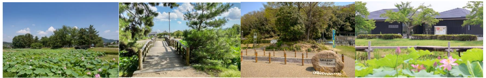
秀吉公本陣跡(石井山) 足守川・高松城水攻め水取入れ口遺跡 太閤ヶ丘遊園地 八幡山陣跡(宇喜多忠家陣所跡)

前泊見学 備中高松城跡 備中高松城址公園 高松城水攻め史跡公園 高松城址公園資料館・宗治蓮(蓮池)