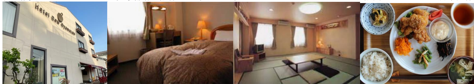
館外食事推奨 大山崎 hermit green cafe 京都・大山崎本店 中国旬菜味彩 三笑亭 お好み焼き山喜