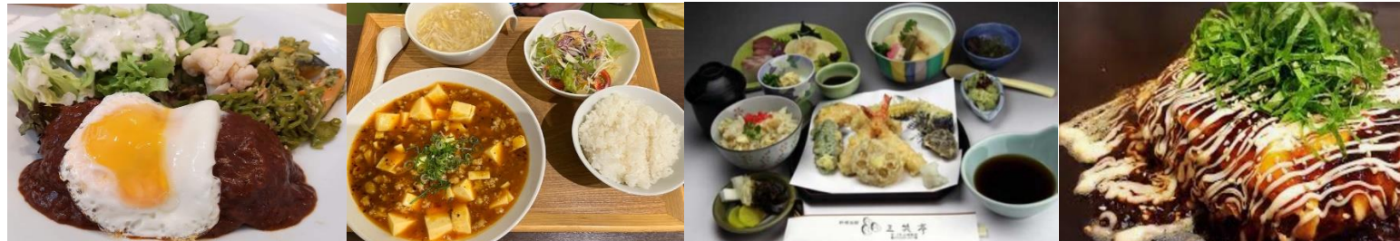
後泊朝食推奨 PaO阪急大山崎店(8時～19時開店) 山崎ウラロジ食堂(9時～15時開店) セブンイレブン阪急大山崎駅前店(24h)