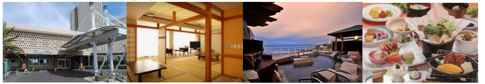
他宿泊推奨 ホテルニュー大新 民宿文治 民宿三浦 前泊観光体験推奨 銚子 ヤマサ醤油 ヒゲタ醤油 銚子漁港 銚子大橋

21日(金)前泊・受付 犬吠埼 絶景の宿 犬吠埼ホテル 〒288-0012 千葉県銚子市犬吠埼9574-1 TEL:0479-22-8111