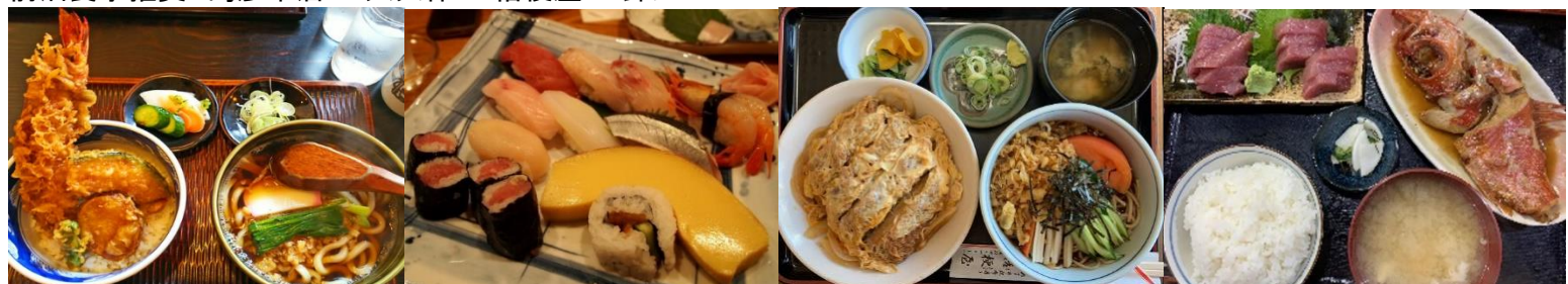
茂利戸屋 中華大塚支店 廣半 大忠屋