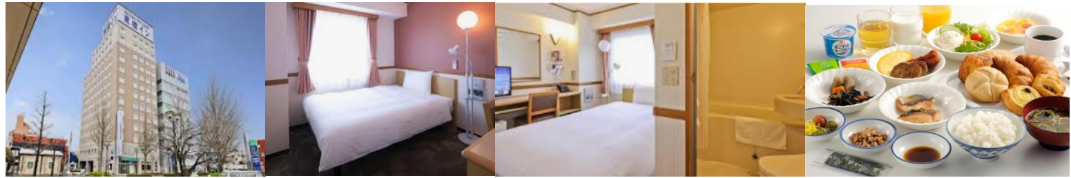
前泊入浴推奨 まえばし駅前天然温泉ゆーゆー 前泊食事推奨 前橋 西洋亭市 真心庵そばひろ 温井製麺 上州御用鳥めし登利平