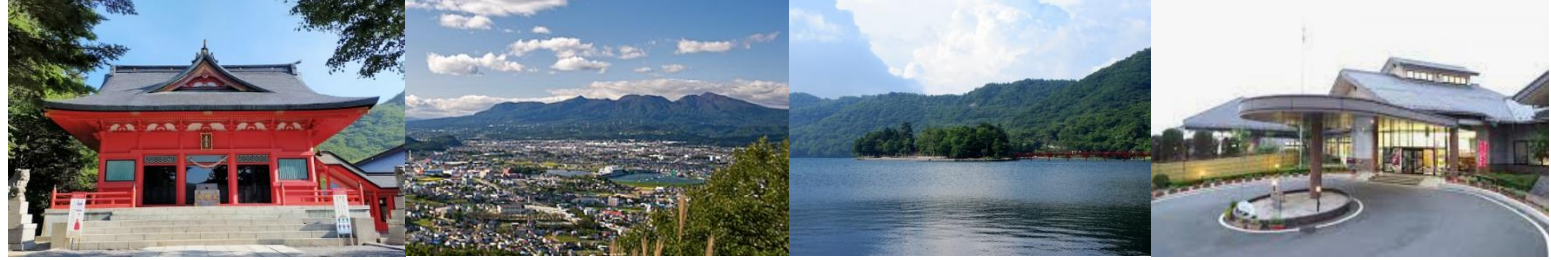
伊香保ロープウェイ 榛名山 榛名山ロープウェイ 榛名湖