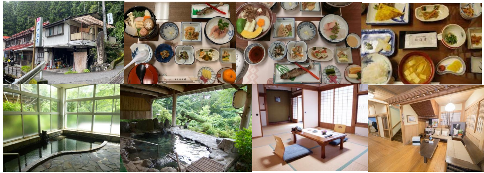
他宿泊推奨 松の湯温泉松溪館 福田屋旅館 川原湯温泉