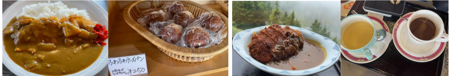
観光休憩推奨 道の駅あがつま峡 草津温泉湯畑 毛無峠 志賀草津道路