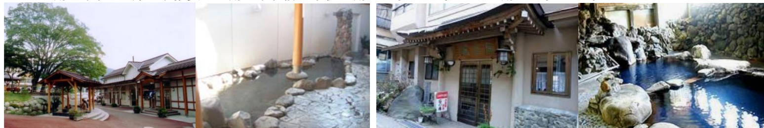
後泊推奨 一茶のこみち美湯の宿(入浴14時～20時) 湯田中温泉大浴場吉の湯(ホテルゆだなか内 入浴11時～21時)