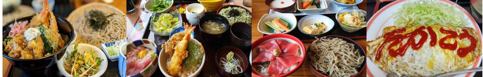
伊勢屋本店 レストランタカラ Cafe & Dining Bar Vingtie バーニーズダイナーハンバーグ