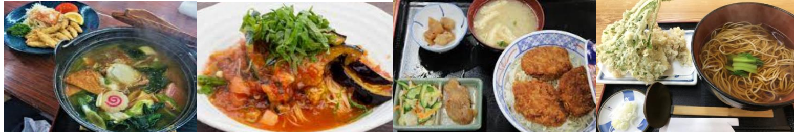
渋川(66km) そば茶屋中しま とんでん渋川店 いっちょう渋川店 たか幸食堂