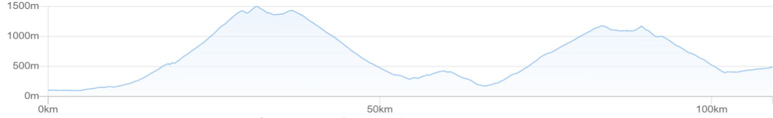
昼食 赤城山(34km) 名月館 トレッカーズカフェ バンディ塩原 曾山商店