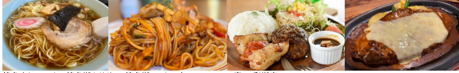
榛名山(83km) 榛名湖ふじや 榛名湖レストハウス ロマン亭 彩湖庵