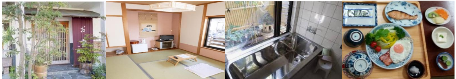
館外夕食推奨 須崎魚河岸 魚貴 須崎本店 食事処喜楽 やのよし とれた亭