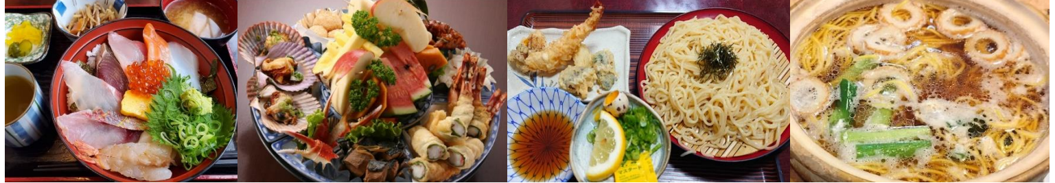
キッチンアズーリ どんじゃか須崎店 居酒屋一休どん 千秋