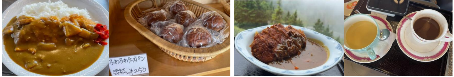
観光休憩推奨 道の駅あがつま峡 草津温泉湯畑 毛無峠 志賀草津道路