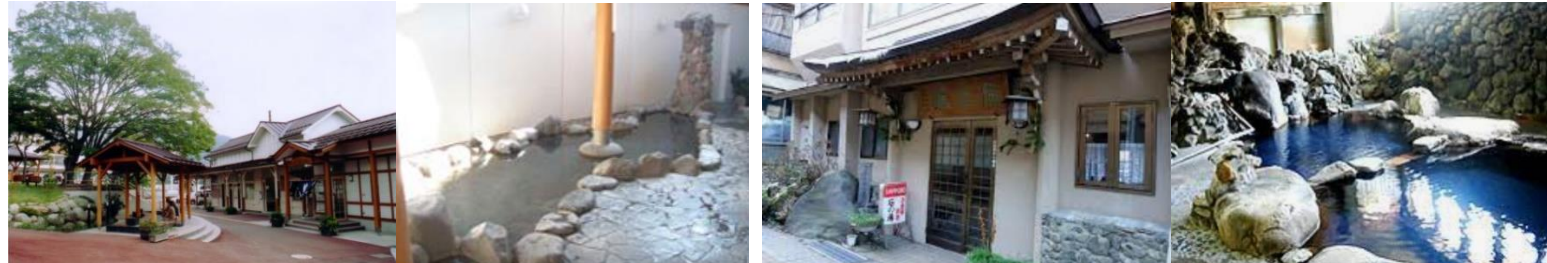
後泊推奨 一茶のこみち美湯の宿(入浴14時～20時) 湯田中温泉大浴場吉の湯(ホテルゆだなか内 入浴11時～21時)