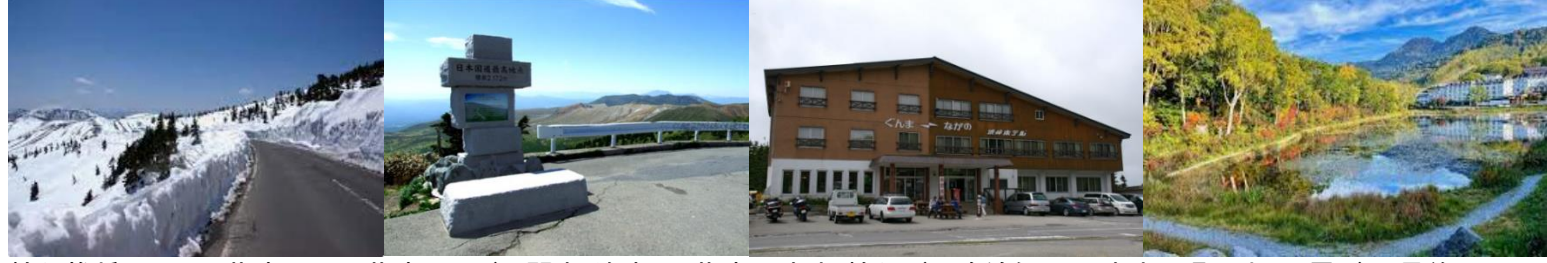
輪行推奨 長野原草津口駅⇄草津:JRバス関東(随時) 草津→渋峠:輪行バス路線無し 渋峠→湯田中:長電バス(最終 15:30) 万座バスターミナル→万座・鹿沢口駅:西部観光バス 14:25→15:09 万座、日新館で途中棄権～日帰り入浴～帰宅可能 ゴール 湯田中駅 日帰り入浴推奨 湯田中駅前温泉楓の湯(10時～21時) 石の湯(10時～18時)