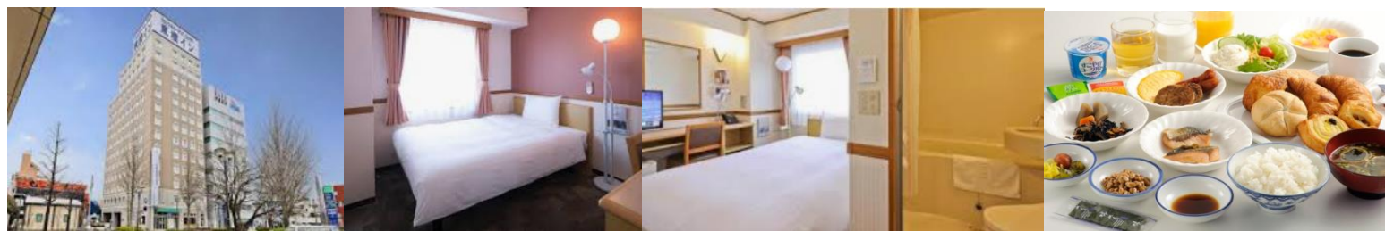
前泊入浴推奨 まえばし駅前天然温泉ゆーゆー 前泊食事推奨 前橋 西洋亭市 真心庵そばひろ 温井製麺 上州御用鳥めし登利平