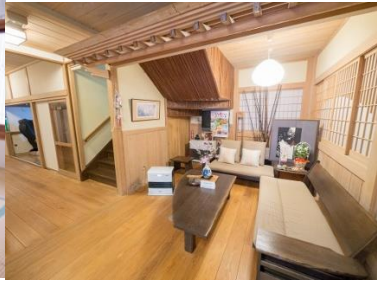
他宿泊推奨 松の湯温泉松溪館 福田屋旅館 川原湯温泉