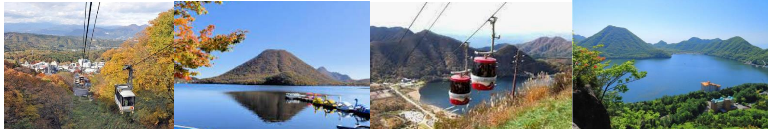
輪行推奨 前橋駅→赤城山ビジターセンター: 関越交通バス前橋赤城山線 推奨8時27分発→9時42分着