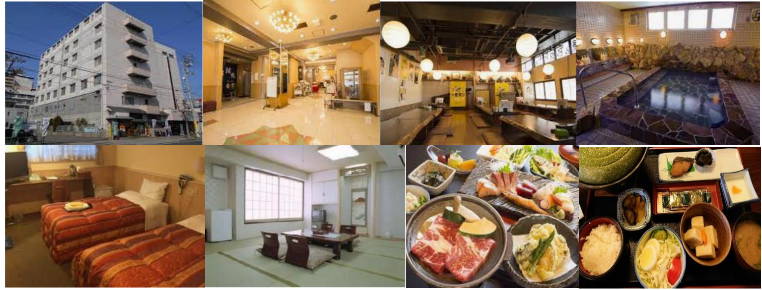
前泊観光推奨: 栗林公園 屋島源平古戦場檀ノ浦・清屋島水族館 平賀源内記念館・旧邸 高松市美術館

集合4月29日(水・祝)8時30分 四国高松温泉ニューグランデみまつ 〒760-0046 香川県高松市通町2-3 087-823-4111 前後泊推奨